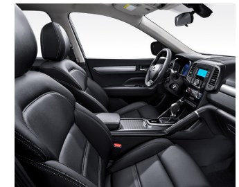
블랙 인조가죽시트 (SE/LE/RE) 실버 페인팅 데코 (SE/LE)