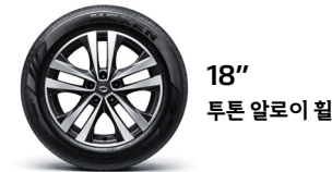
18" 투톤 알루미늄 휠