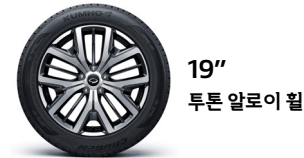
19" 투톤 알루미늄 휠