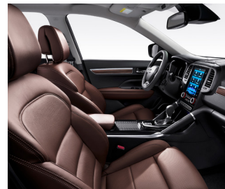
시에나 브라운 가죽시트 (RE/RE Signature 옵션) 우드 그레이인 (RE Signature)