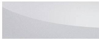
클라우드 펄 Cloud Pearl