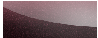
빈티지 레드 Vintage Red ( PREMIERE )