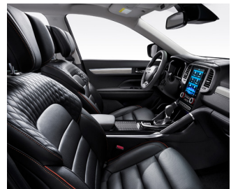
블랙 퀴팅 나파 가죽시트 ( PREMIERE ) 베르사유 그레이인 ( PREMIERE )