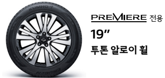
PREMIERE 전용 19" 투톤 알루미늄 휠