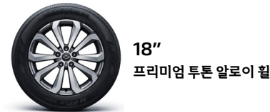
18" 프리미엄 투톤 알루미늄 휠