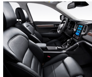
블랙 가죽시트 (RE Signature) 우드 그레이인 (RE Signature)