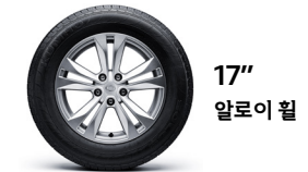
17" 알루미늄 휠