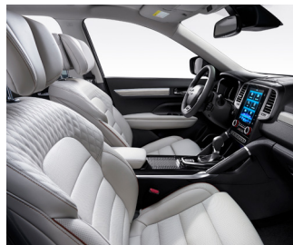
그레이 퀴팅 나파 가죽시트 ( PREMIERE ) 베르사유 그레이인 ( PREMIERE )