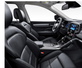
블랙 인조가죽시트 (SE/LE/RE) 허니컴 패턴 그레이인 (RE)