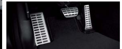
블랙 내장재(헤드라이닝, 필라 트림 등), 메탈 페달