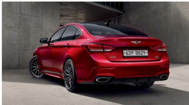
전용 듀얼 머플러, 사이드실 몰딩, 다크 스포터링휠