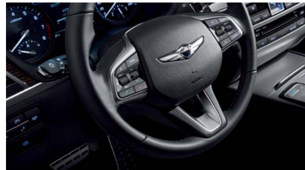
3-스포크 스티어링 휠