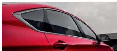
라디에이터 그릴, 다크 서라운드 몰딩