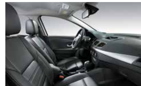
고급 블랙 인조가죽시트 (PE) 글로시 실버 페인팅 데코 (PE)