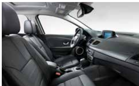
최고급 블랙 가죽시트 (RE 선택사양 포함 이미지) 알루 브러시드 패턴 그레이 (RE)