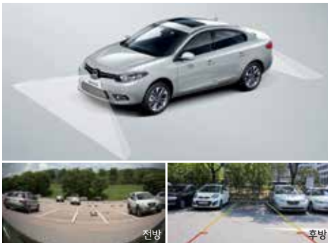
순정용품 내비게이션 V7 패키지 - (순정용품 내비게이션 V7 + 전/후방 카메라)