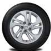
16" 알루미늄 휠