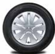
15" 스틸 휠