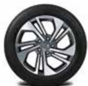
17" 그레이 투톤 알루미늄 휠