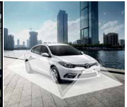
360° 스카이뷰 카메라 (Around View Monitoring)