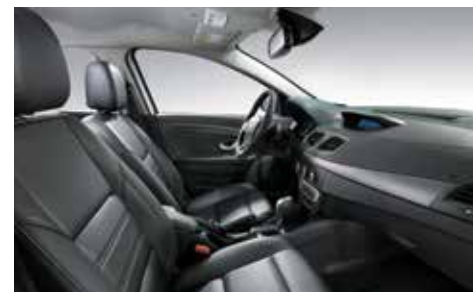
고급 블랙 인조가죽시트 (SE) 알루 브러시드 패턴 그레이 (SE)