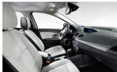
최고급 플레티넘 그레이 가죽시트 (LE 선택사양 포함 이미지) 알루 브러시드 패턴 그레이 (LE)