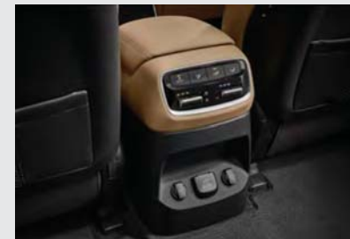
후석 에어컨 & 히터컨트롤 (6인승/7인승)