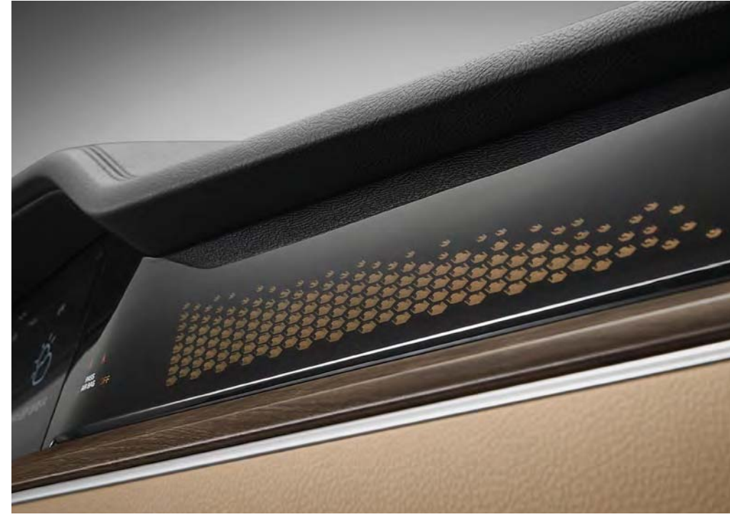
입체 패턴 무드램프