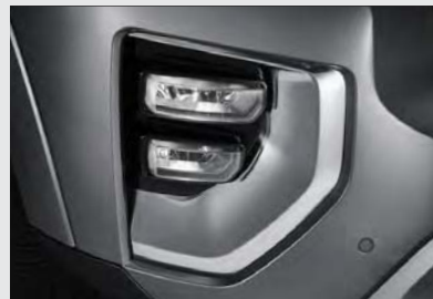
LED 듀얼 포그 램프 (코너링 기능 포함)