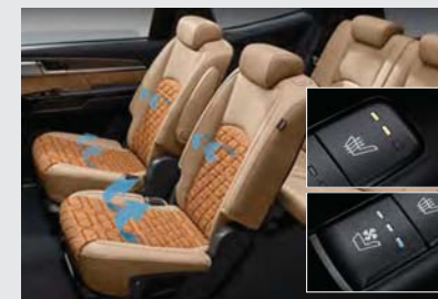
2열 열선 / 통풍 시트 (6인승)*