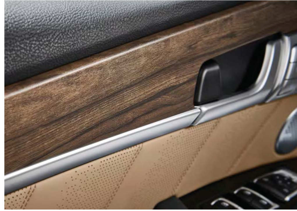
오크 우드그레인 가니쉬