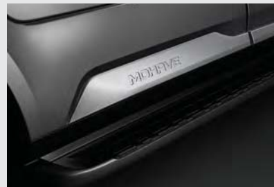
도어가니쉬 크롬 몰딩