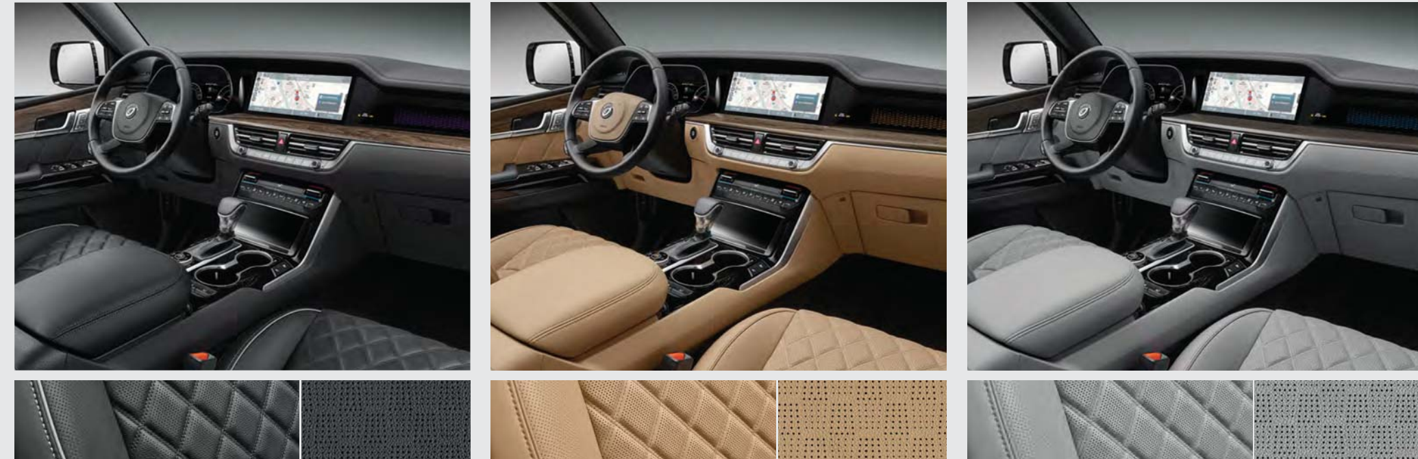
블랙 인테리어 (퀼팅 나파가죽 / 가죽)