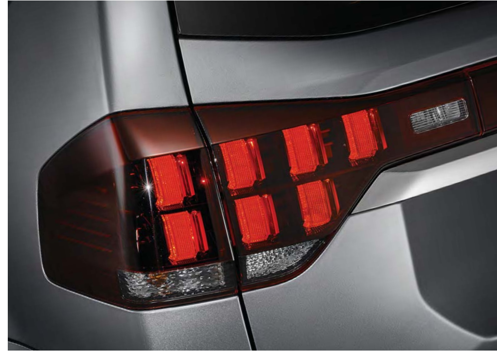
버티컬 큐브 리어 콤비네이션 램프