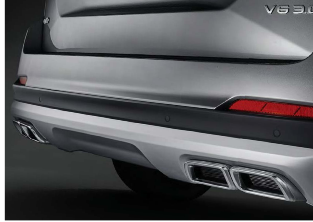
듀얼 트윈팁 데코 가니쉬