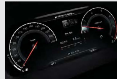
슈퍼비전 클러스터 (12.3인치 풀사이즈 칼라 TFT LCD)