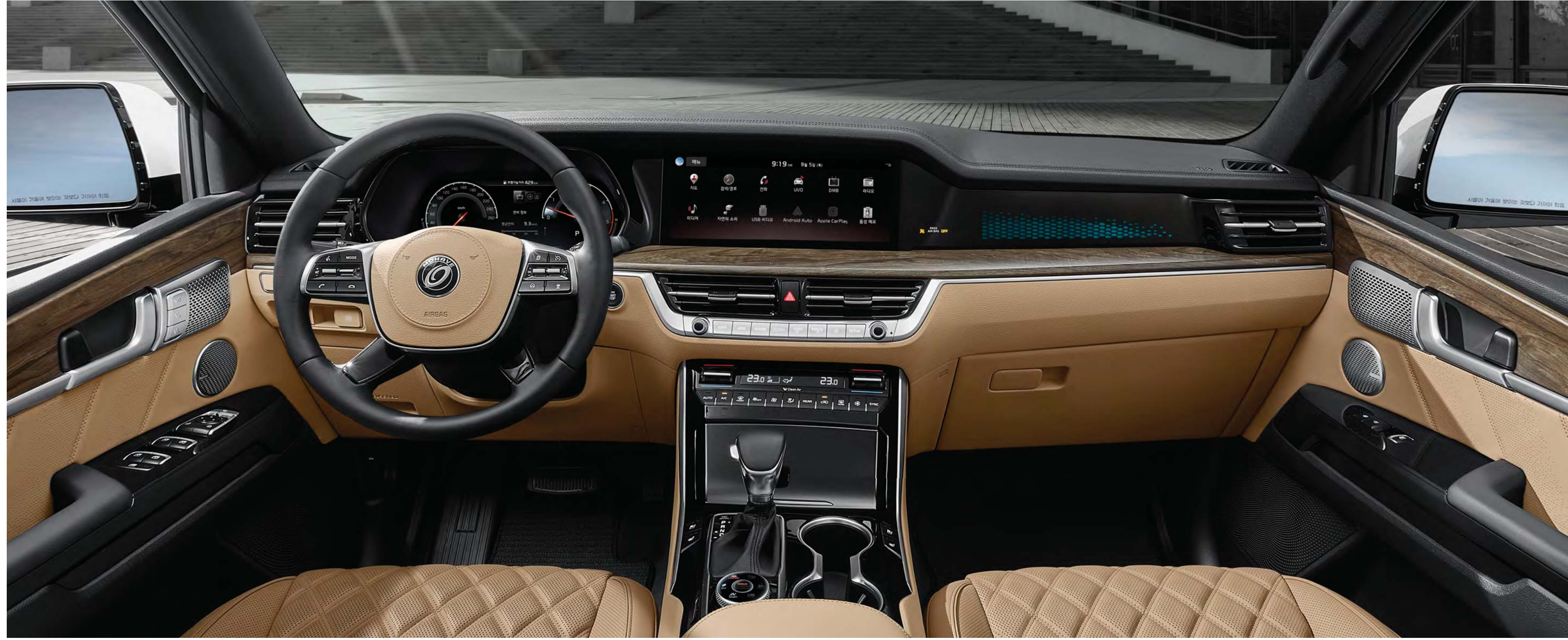
보이는 복잡함은 덜어내고 경험의 다양성은 늘렸습니다. 가로로 길게 뻗은 디자인은 탁 트인 지평선을 보는 듯합니다. 디스플레이와 입체 패턴 무드램프로 채운 대쉬보드는 첨단 트렌드를 담은 하이테크를 보여줍니다.