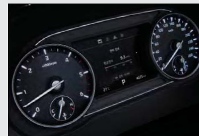
슈퍼비전 클러스터 (7인치 칼라 TFT LCD)