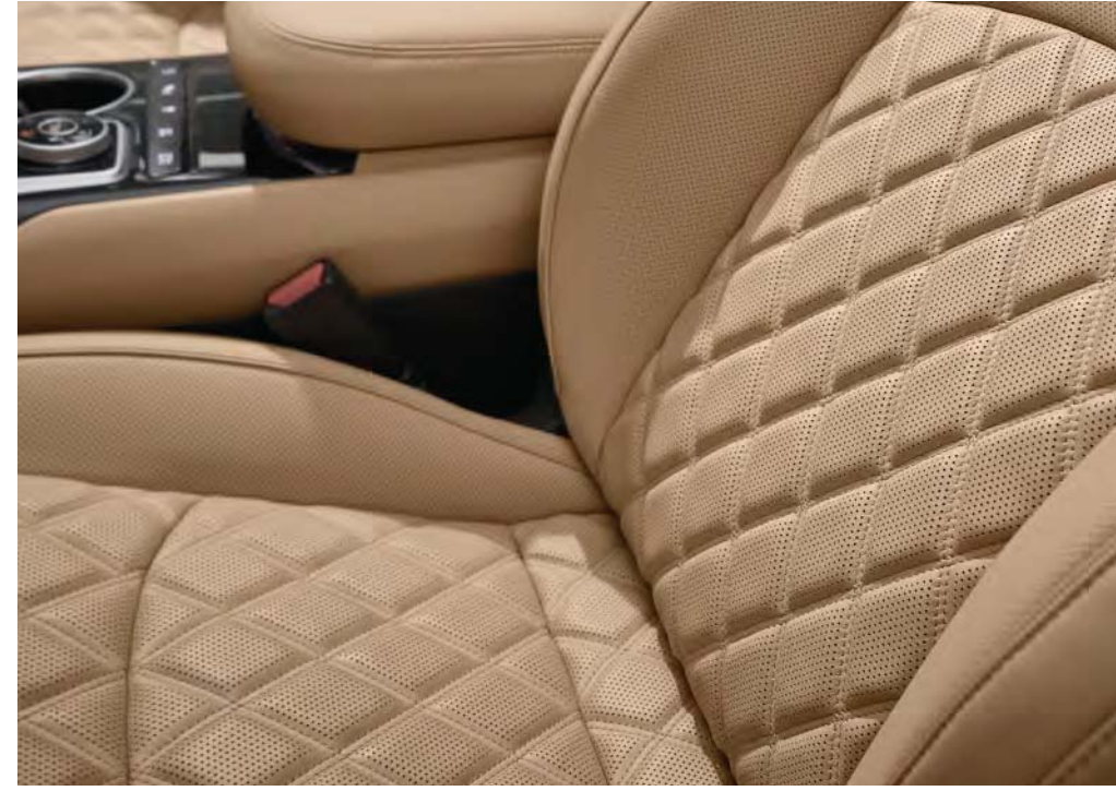
퀵팅 나파가죽 시트