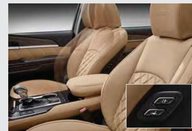
동승석 워밍업 디바이스*