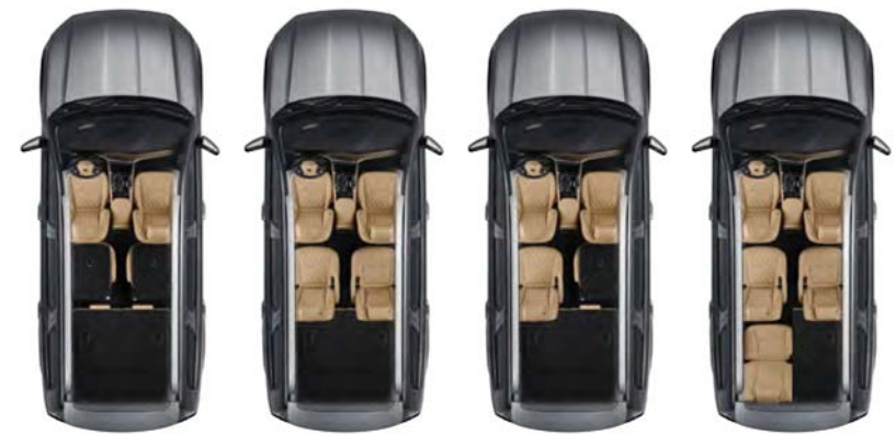
시트 배리어이션 (6인승)