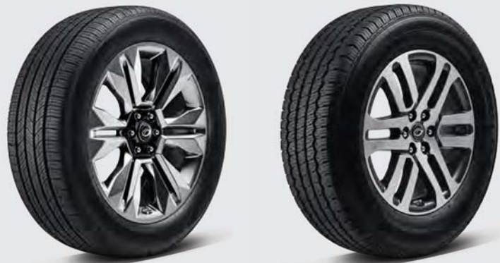
20인치 스포터링 휠