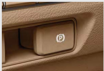
전자식 파킹 브레이크 (EPB)