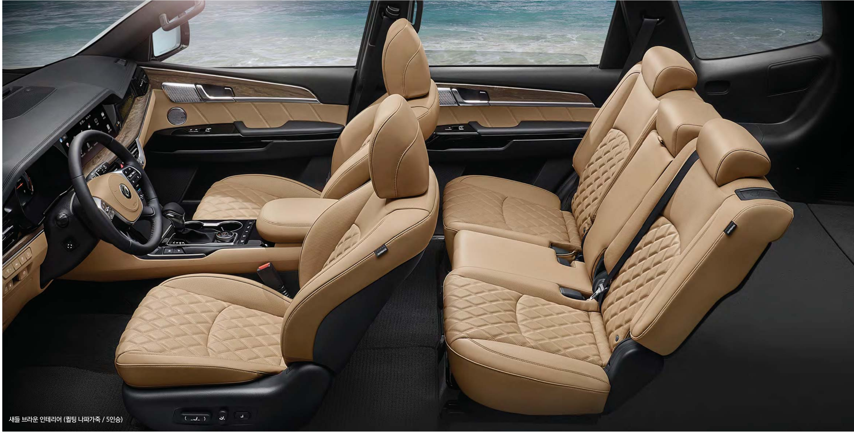
새들 브라운 인테리어 (퀼팅 나파가죽 / 5인승)