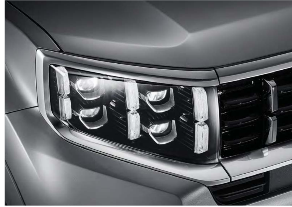
풀 LED 헤드램프 & 버티컬 큐브 DRL