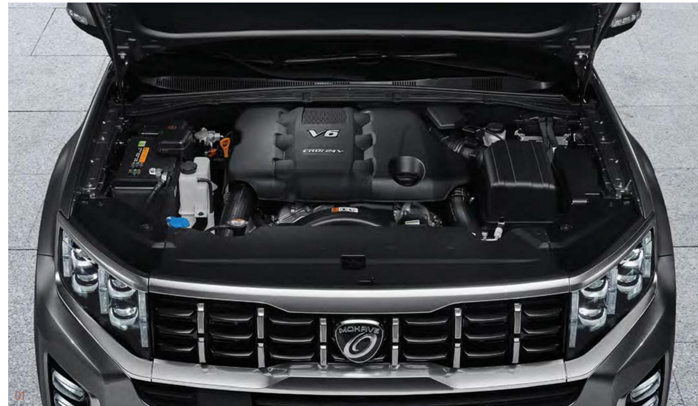
02 랙 구동형 전동식 파워스티어링 (R-MDPS)

260 최대출력 ps 3,800 rpm 57.1 최대토크 kgf · m 1,500~3,000 rpm