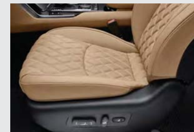
운전석 파워시트 & 전동식 램버서포트