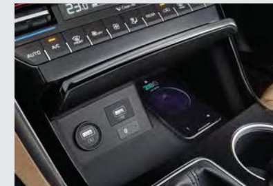
휴대폰 무선충전 & USB 충전단자