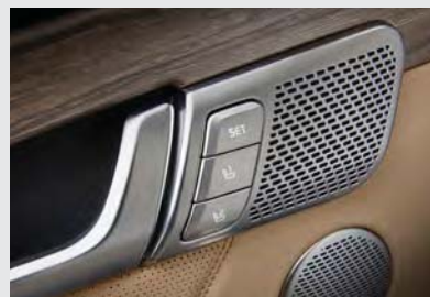
운전자세 메모리 시스템 (IMS)