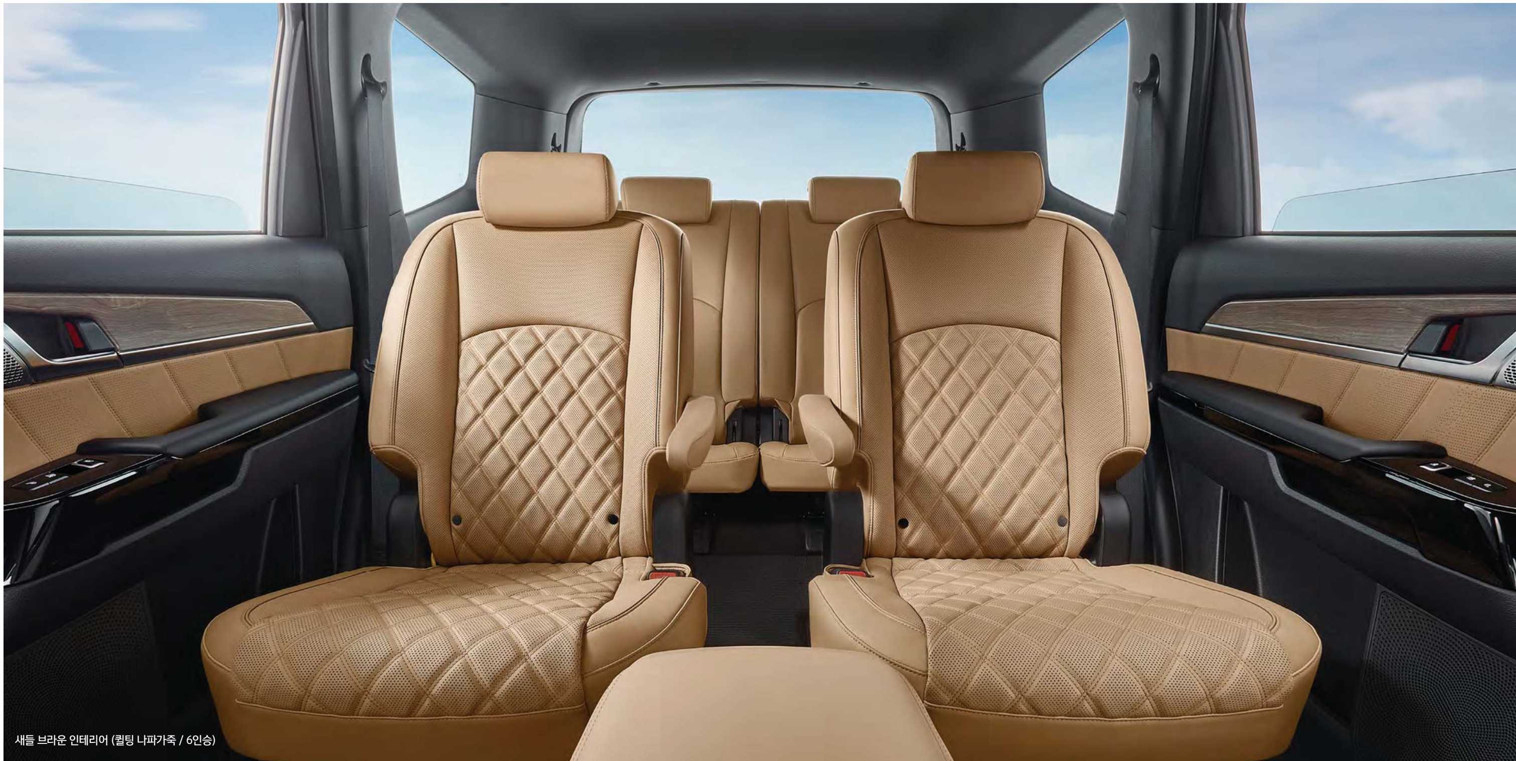
새들 브라운 인테리어 (퀼팅 나파가죽 / 6인승)