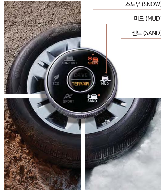
04 주행모드 통합제어 시스템

노면의 특징에 따라 스노우-머드-샌드 모드로 선택 주행할 수 있으며, 최적화된 제어로 안정적인 주행을 도와줍니다.