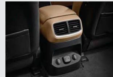
센터콘솔 에어벤트 (5인승)