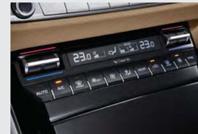
독립제어 풀오토 에어컨 (운전석, 동승석)