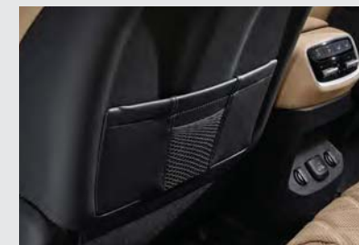
시트백 스마트 포켓