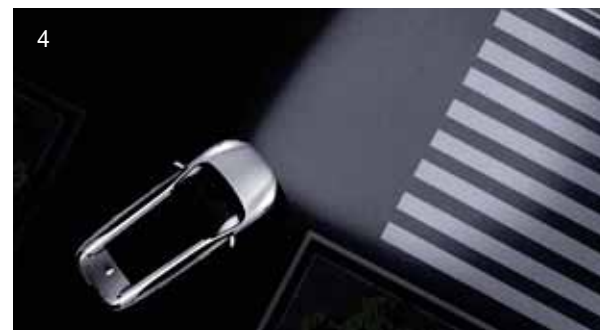
1. (FCW) / (FCA)*