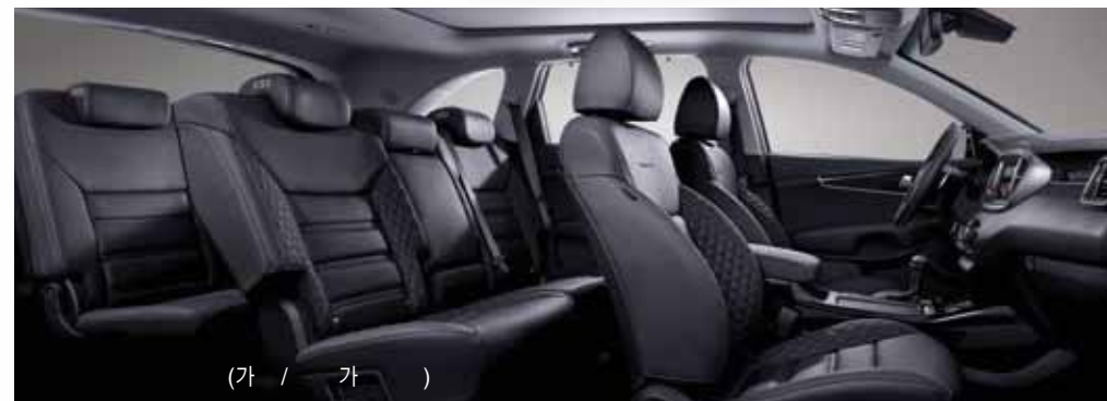
(가 / 가 )