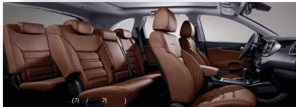
(가 / 가 )