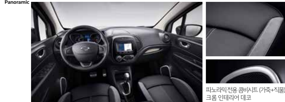
파노라믹전용 콤비시트 (가죽+직물) 크롬 인테리어 데코