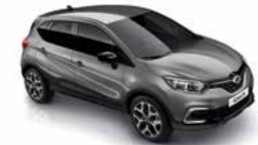
카본 그레이 Carbon Grey