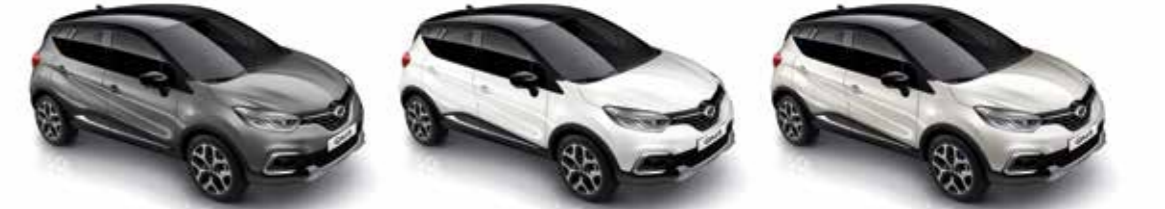
카본 그레이 (블랙 루프) Carbon Grey