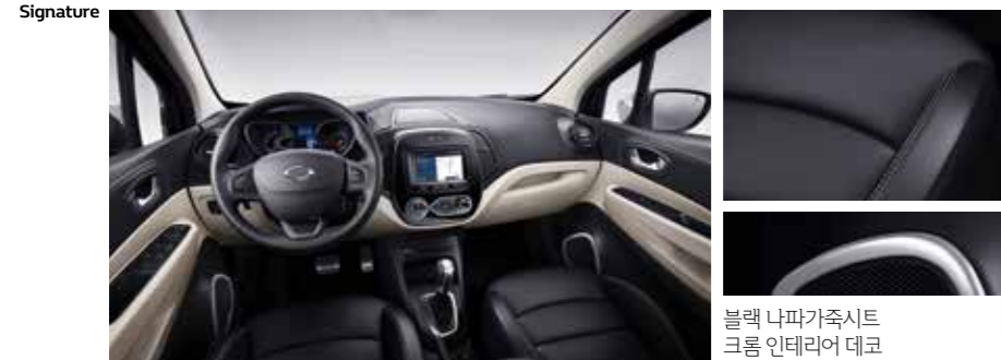
블랙 나파가죽시트 크롬 인테리어 데코