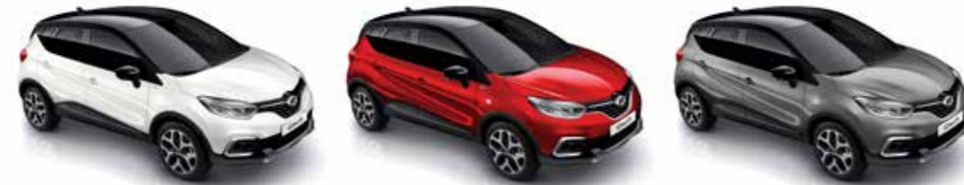
에투알 화이트 (블랙 루프 & 전용 데칼) Etoile White