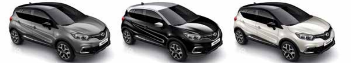
카본 그레이 (블랙 루프) Carbon Grey