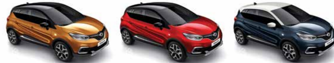
아타카마 오렌지 (블랙 루프) Atacama Orange