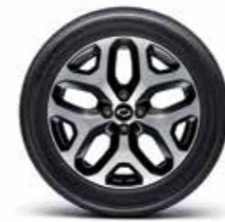
17" 블랙 투톤 알로이 휠 205/55R 17 타이어