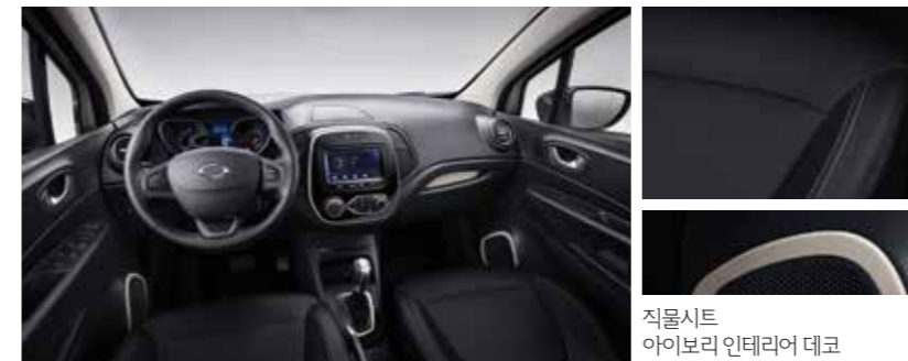
직물시트 아이보리 인테리어 데코