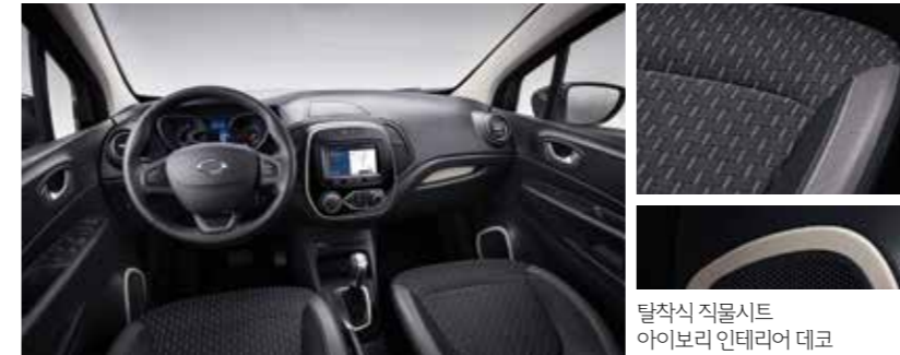
탈착식 직물시트 아이보리 인테리어 데코