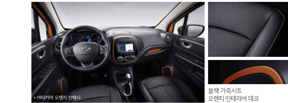
* 아타카마 오렌지 선택시