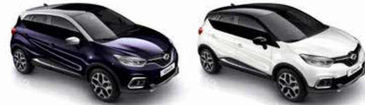
아메시스트 블랙 (그레이 루프) Amethyste Black